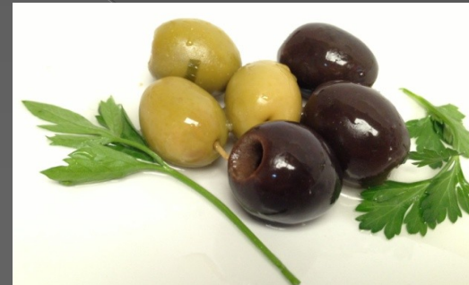
ACEITUNAS NEGRAS Y VERDES