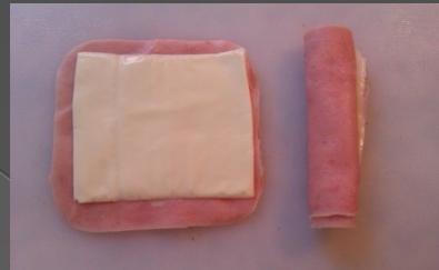
JAMÓN Y QUESO