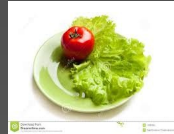
TOMATE Y LECHUGA